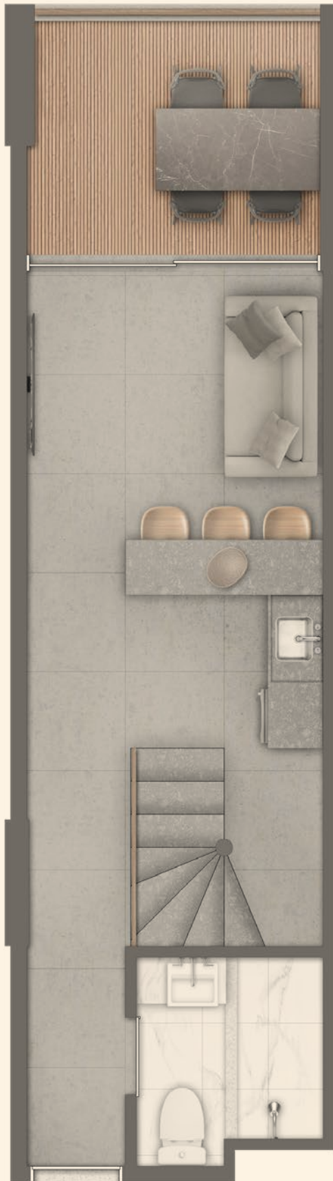
ANDAR INFERIOR Apartamento Duplex