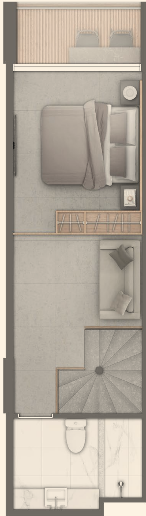
ANDAR SUPERIOR Apartamento Duplex