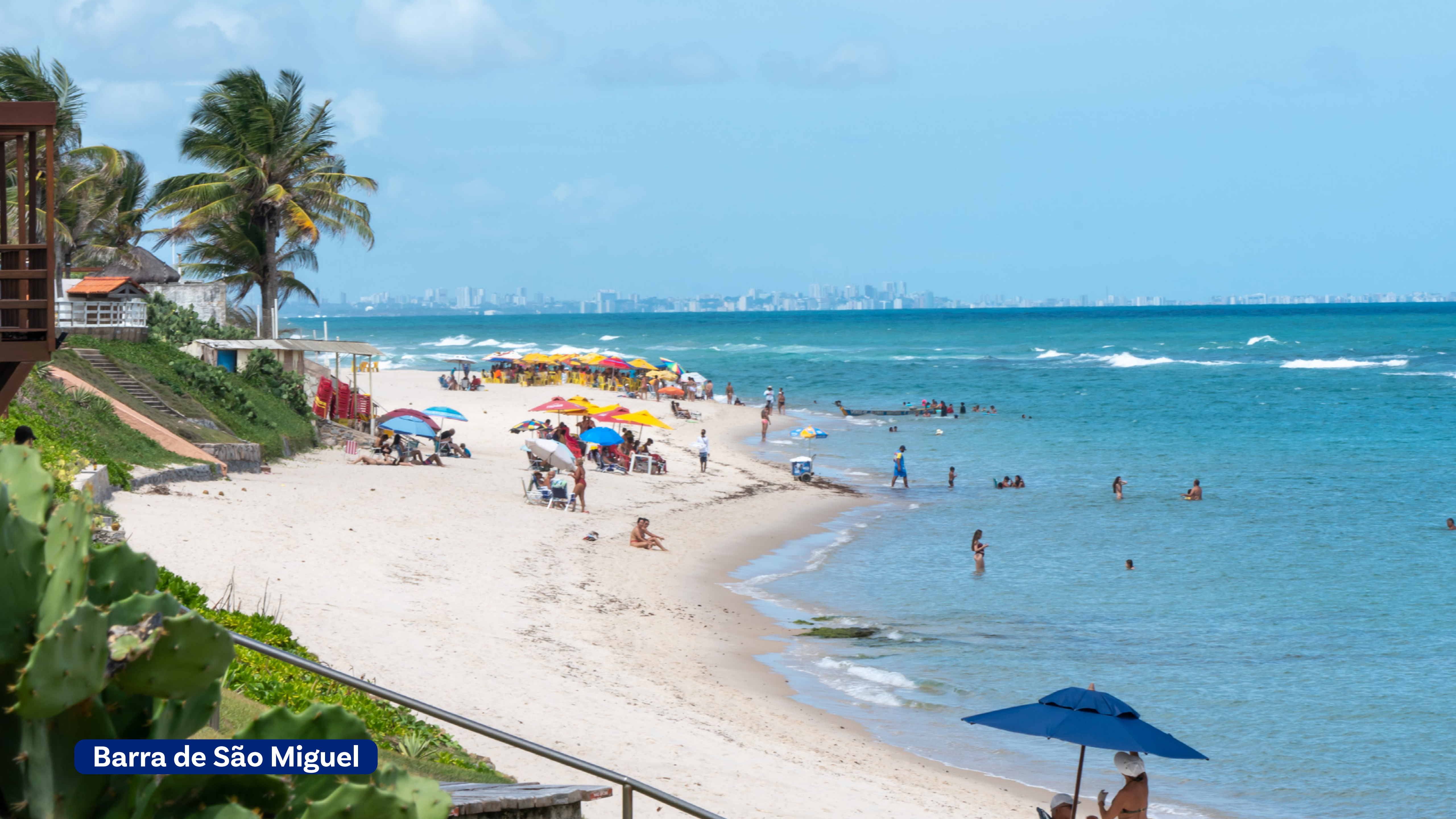
Barra de São Miguel