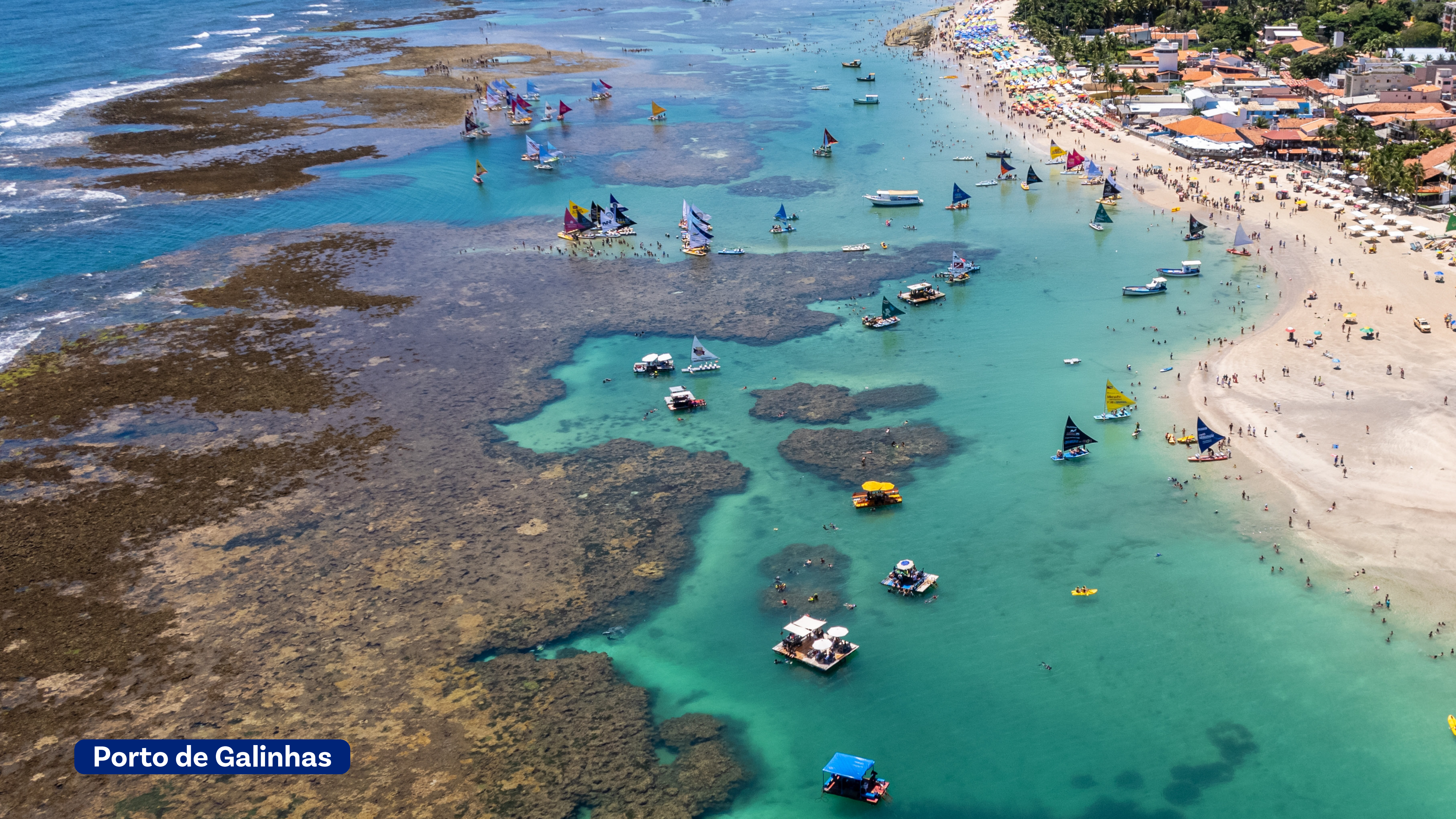
Porto de Galinhas