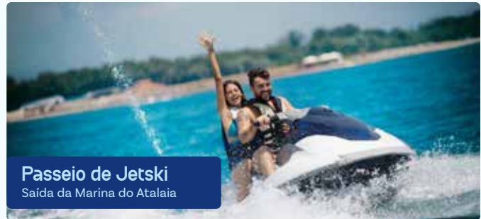
Passeio de Jetski Saída da Marina do Atalaia

Um percurso com vista da fauna, flora e ilhas locais. Parada para fotos e banho. Segue pelo Rio Sampaio, contorna uma ilha com belos animais, chega a um ponto com vista para o mar e finaliza em uma ilhota para banho e fotos.