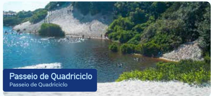
Passeio de Quadriciclo Passeio de Quadriciclo

Um percurso com vista da fauna, flora e ilhas locais. Parada para fotos e banho. Segue pelo Rio Sampaio, contorna uma ilha com belos animais, chega a um ponto com vista para o mar e finaliza em uma ilhota para banho e fotos.